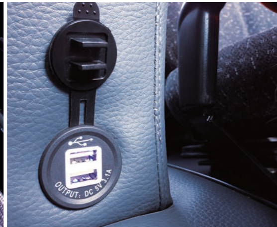
2-fach USB-Steckdose am rechten Staufach