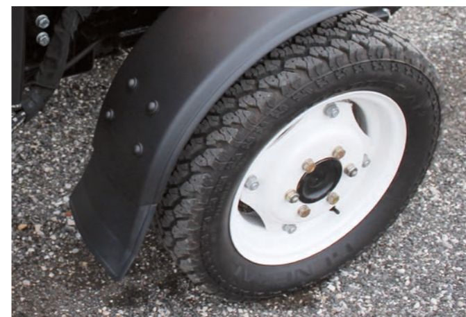
Vorderrad-Kotflügel mit Spritzschutz