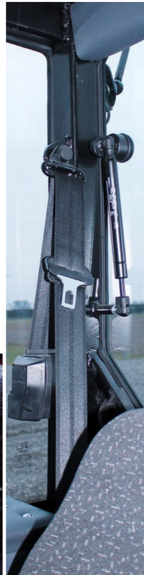
3-Punkt Sicherheitsgurte für Fahrer und Beifahrer