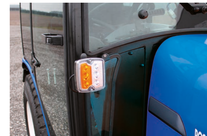
LED-Blinker und Begrenzungsleuchten