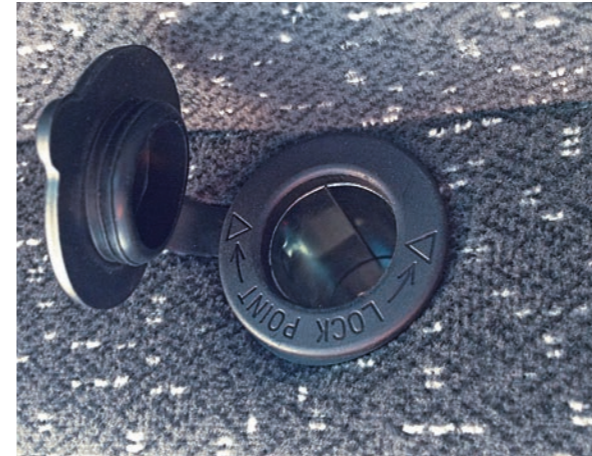
12 Volt-Steckdose rechts im Dachbereich

Soundsystem mit Digital Media Receiver und Bluetooth-Freisprecheinrichtung, Schalterkonsole, Sicherungskasten und Sonnenrollo