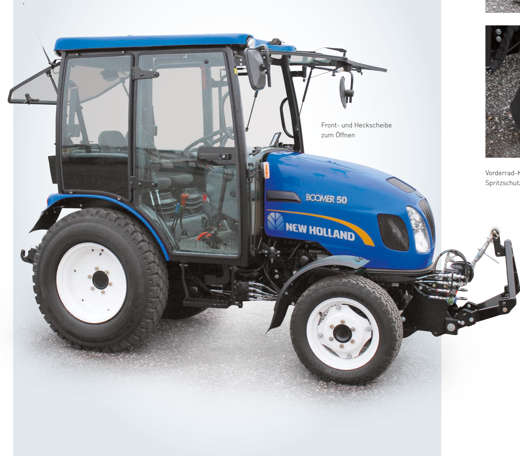
Front- und Heckscheibe zum Öffnen