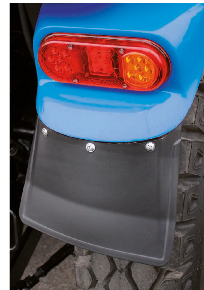
LED-Rücklichter und Spritzschutz hinten