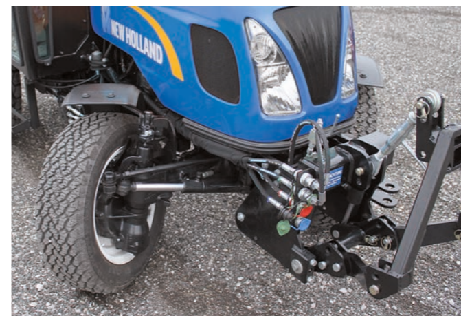
Optional: Profi-Front- kraftheber mit Kuppel- dreieck oder 3-Punkt-Auf- nahme und 4 Hydraulik- anschlüssen BG3