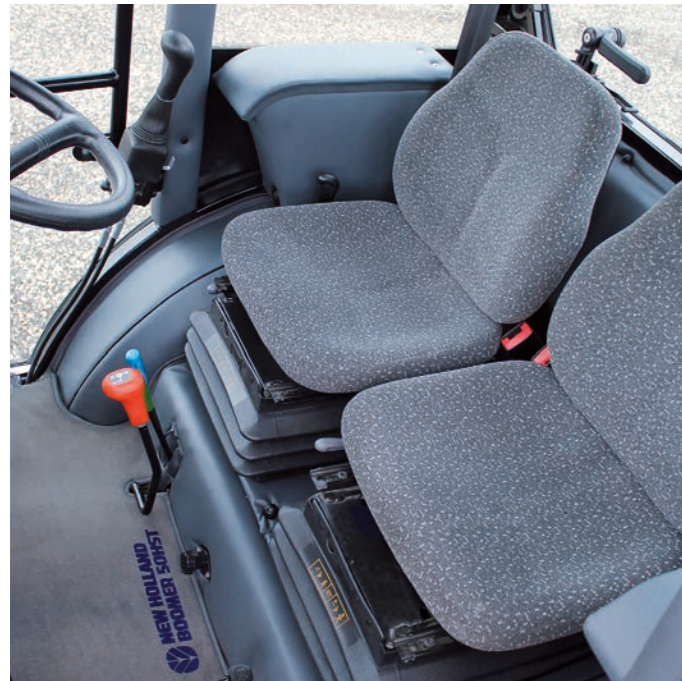
2 Komfortsitze mit Luftfederung und Staufächern