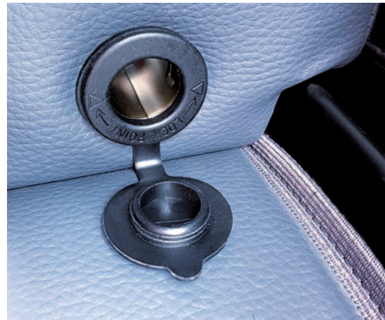
12 Volt-Steckdose am linken Staufach